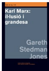
Karl Marx: Il·lusió i grandesa Gareth Stedman Jones