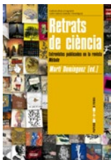
Retrats de ciència Martí Domínguez (ed.)