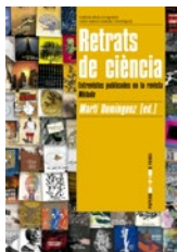
Retrats de ciència Martí Domínguez (ed.)